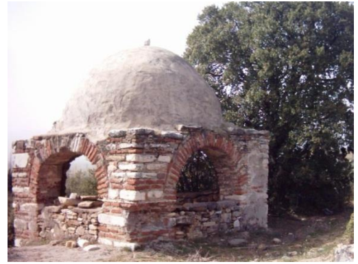
Haliller Köyü Vakıflar Mahallesi Türbesi