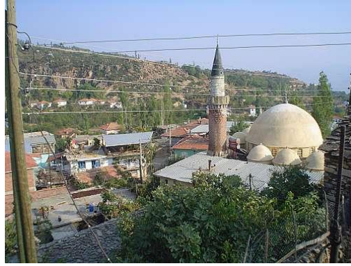
Cevizli Köyü Camii ve Minaresi