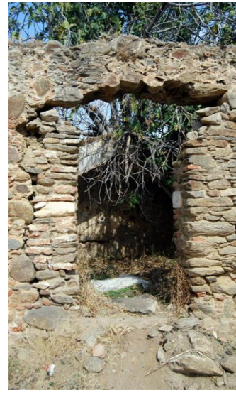
Suludere Köyü Selçuklu Hamam kalıntısı