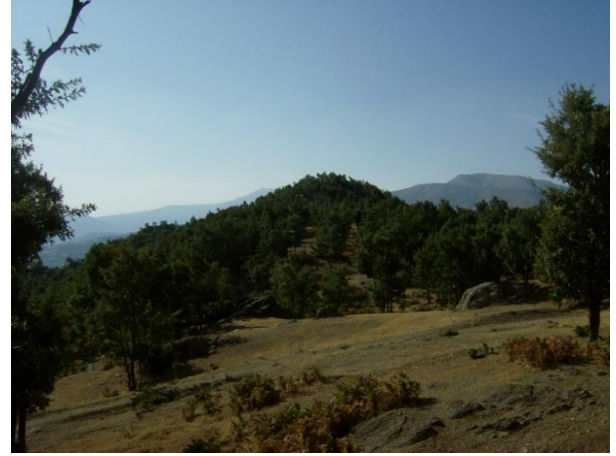
Erenler Tepesi Tümülüsü (Kaya Mezarlığı)

Erenler Tepesi Tümülüsü, Kültür ve Turizm Bakanlığı İzmir I Numaralı Kültür ve Tabiat Varlıklarını Koruma Kururlu (TVKK)'nun 22.07.1999 tarih ve 8077 sayılı kararı ile SİT Alanı olarak tescil edilmiştir.