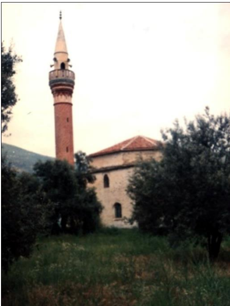
Suludere Köyü Camii

Suludere'de Anadolu Selçuklu Devleti döneminden kalma cami, medrese, çeşme ve hamam bulunmaktaydı. Ancak, şu anda sadece Camii ve Çeşme ayakta kalabilmiş. Medrese yıkılmış, yerine şimdi (kullanılmayan) ilkokul binası inşa edilmiş. Yolun karşısındaki hamam da harabe halde; çatısı çökmüş, duvarlarının bir kısmı yıkılmış, içinde incir ağacı bitmiş. Söylenildiğine göre; hamam elden geçirilecek, çevre düzenlemesi yapılacak ve ışıklandırılacakmış