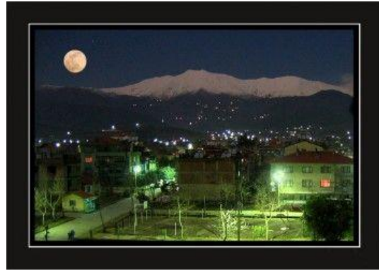
Küçük Menderes'ten Bozdağ'a Gece