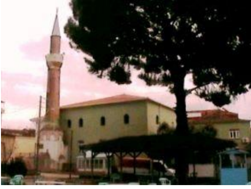
Kiraz İsa Bey (Ulu) Camii

İsa Bey Camii/Kiraz Ulu Cami: Aydınolu Beyi İsa Bey tarafında yaptırılmıştır. İsa Bey, Aydınolu Beyi olarak 1360-1390 yılları arasında hüküm sürmüştür. Bu caminin tam olarak tarihi bilinmemektedir. Cumhuriyet Mahallesi'ndeki İsa Bey Camii, Aydınolu İsa Bey'in yaptırdığı üç camiden biridir. Diğer ikisi Tire ve Selçuk'tadır.