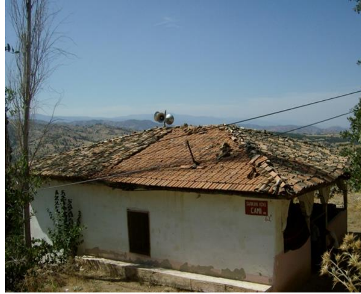
Sarıkaya Köyü Camii

Osmanlı Dönemi eseridir. Hayırseverlerden Hacı Mehmet Efendioğlu Hasan tarafından R.1309-M.1893 tarihinde yaptırılmıştır. Kare planlı camii, alaturka kiremit kaplamalı ve kırma ahşap çatılı ve geniş ahşap saçaklıdır. Ahşap dikmelerin birbirine yuvarlak kemerlerle bağlı olduğu ve ahşap çatı ile örtülü son cemaat yerine sahiptir. Son cemaat yerinin doğu yönü duvarla kapalı iken, batı yönü açık bırakılmıştır. Bitkisel ve geometrik motiflere sahip ahşap giriş kapısı dikkat çekicidir. Niş şeklindeki mihrabı oldukça sade bırakılmıştır. Ahşap minberi de sadedir. Tavanı ahşap kaplamalı olup, geometrik motiflerle bezenmiştir. Sarıkaya Köyü, Tarlabası Mevkii'de yer alır. İzmir II Numaralı KTVKK'nun 26.01.2006 tarih ve 1770 sayılı kararı ile tescil edilmiştir.