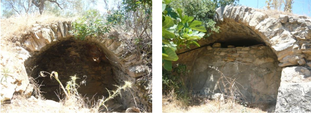
Kale Antik Kenti civarındaki Tonoz (Tolaz) resimleri

Tol: Mimaride, üstü kemer tonozla örtülü bina demektir.