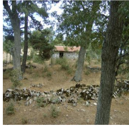
Haliller Köyü Tarihî Eserleri

Osmanlı Dönemi eseridir. Çayağzı Köyü, Tarlabası Mh. Kırtaş Tepe'de yer alır. Dikdörtgen planlı türbe moloz taştan inşa edilmiştir. Ahşap beşik çatısı marsilya kiremit kaplıdır. İçinde moloz taşlarla örülü bir mezar vardır. İçinde türbenin yer aldığı geniş bir alana yayılmış mezarlık, yöre halkı tarafından kutsal bir yer olarak kabul edilmektedir. İzmir II Numaralı KTVKK'nun 26.01.2006 tarih ve 1770 sayılı kararı ile tescil edilmiştir.