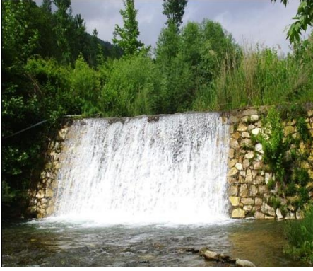
Kiraz Çatak Köyü Şelâlesi

Kış ve ilkbaharda kar eksik olmayan Bozdağ da bir doğa harikasıdır. Çavuş Dağı, Dokuzlar, Ovacık, Emenler, Altınoluk, Cevizli, Tekke, Ozan, Karakoyun Yaylaları da görülmeye değer mesire ve piknik alanlarından bazılarıdır.