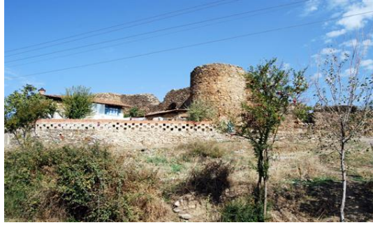
Kiraz Hisar Köyü Asar Kalesi