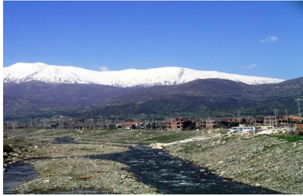
Küçük Menderes Vadisi ve Bozdağ