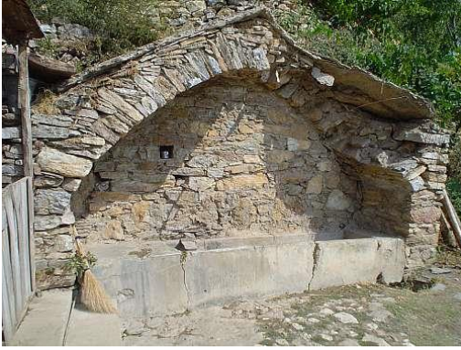
Cevizli Köyü Çeşmesi